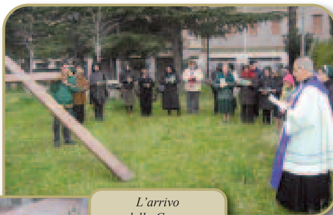
L'arrivo della Croce.

La permanenza della Croce in Santuario è stata un'occasione per offrire a tutti i membri della Comunità Parrocchiale la possibilità della Riconciliazione sacramentale e per radunare in preghiera i giovani, attorno al segno